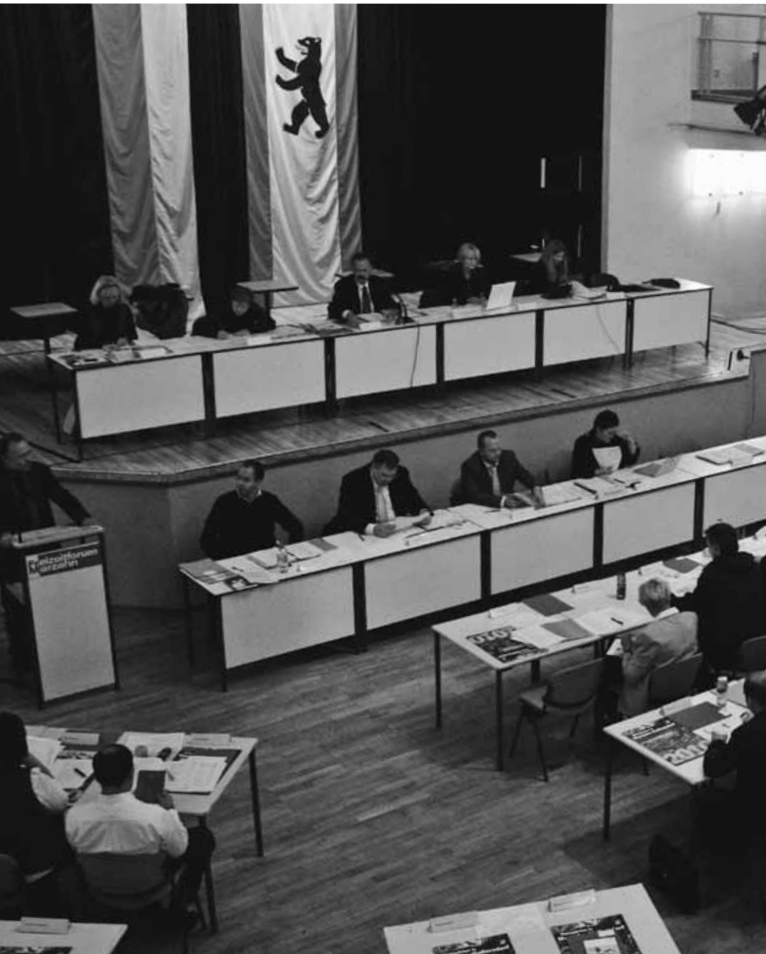
Sitzung der BVV Marzahn-Hellersdorf im Freizeitforum Marzahn

AUF BUNDES-, LANDES- UND KOMMUNALER EBENE – AKTUELLE ENTWICKLUNGEN