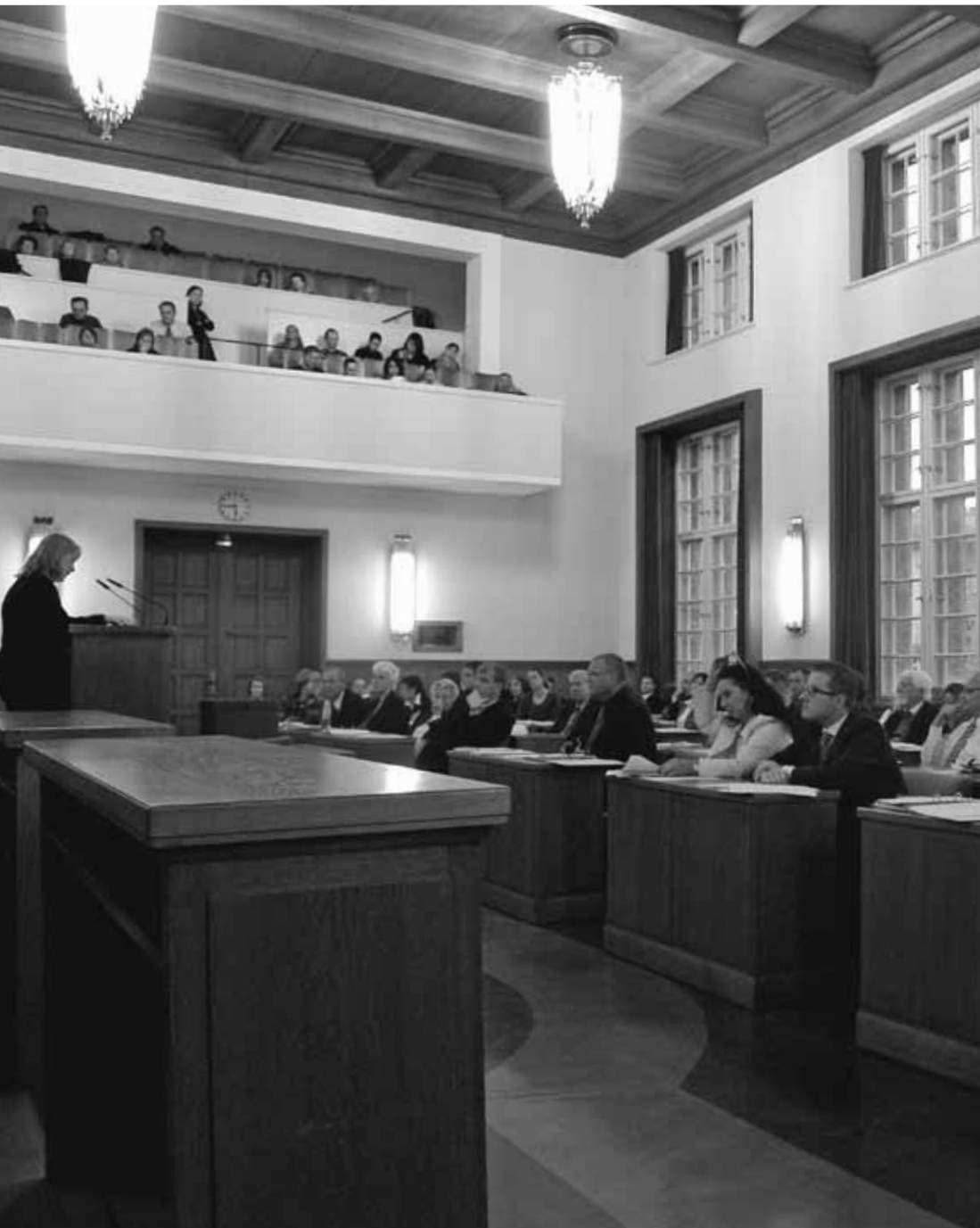
Sitzung der BVV Neukölln im Rathaus Neukölln

IM UMGANG MIT RECHTSEXTREMEN: DIE EINSCHÄTZUNGEN DEMOKRATISCHER BEZIRKSVERORDNETER