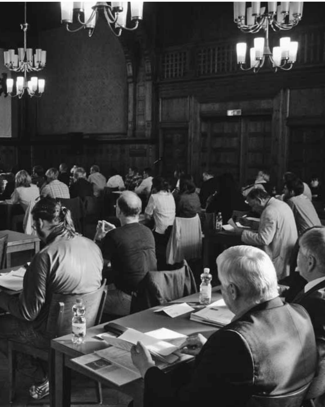
Sitzung der BVV Treptow-Köpenick im Rathaus Köpenick

IN DER DEMOKRATISCHEN AUSEINANDERSETZUNG MIT RECHTSEXTREMEN IN KOMMUNALEN GREMIEN – EINE KURZE EINFÜHRUNG