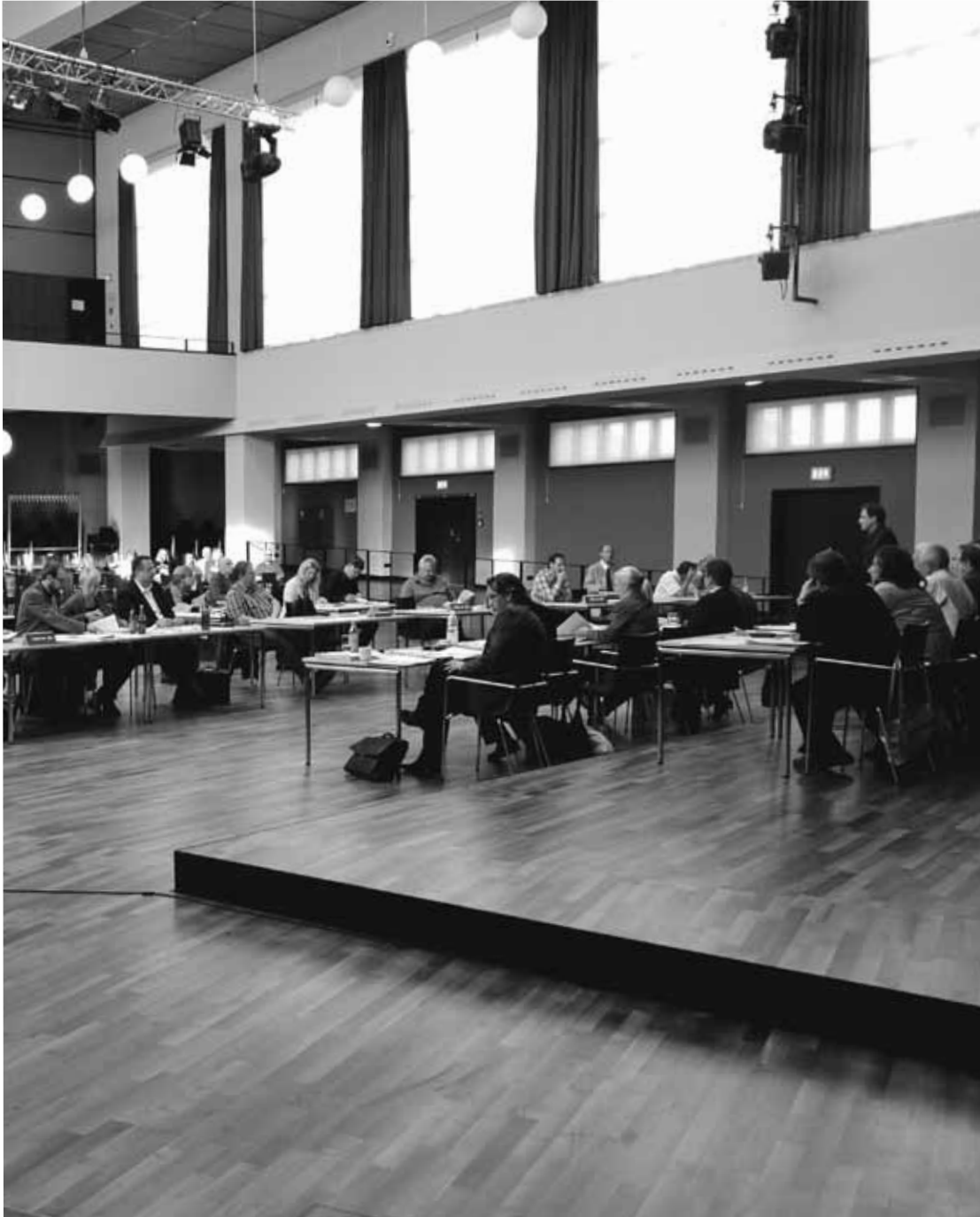
Sitzung der BVV Lichtenberg in der Aula der Max-Taut-Schule